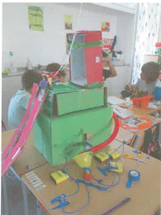
La torre elèctrica

Aquests són alguns dels exemples de les creacions elaborades amb la fitxa explicativa i a la pàgina web de l'escola podeu veure els vídeos amb els invents presentats per l'alumnat i posats en funcionament.